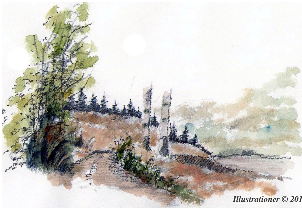
Illustrationer © 2016 Erik Bay