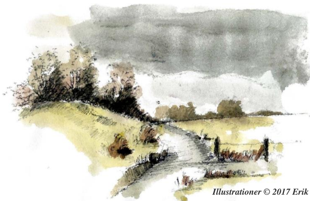
Illustrationer © 2017 Erik Bay