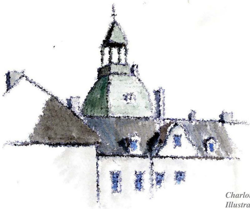
Charlottenlund - tur 30/3 Illustration: Erik Bay