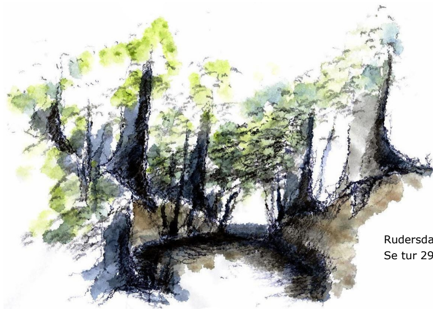
RudersdalRuten af Erik Bay. Se tur 29/8 Vandremaraton.