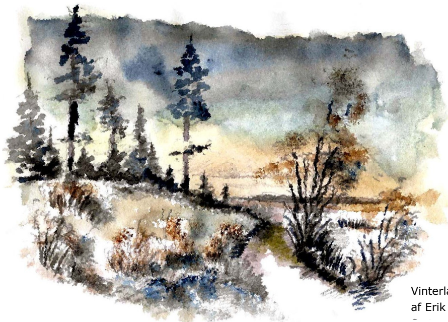
Vinterlandskab af Erik Bay