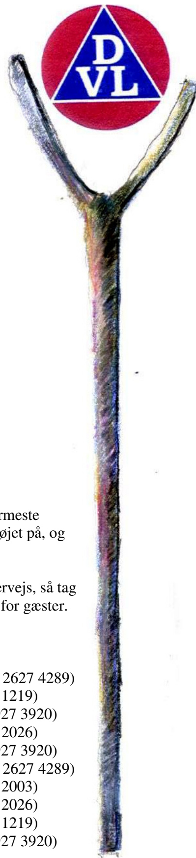
Alle øvrige illustrationer af Erik Bay