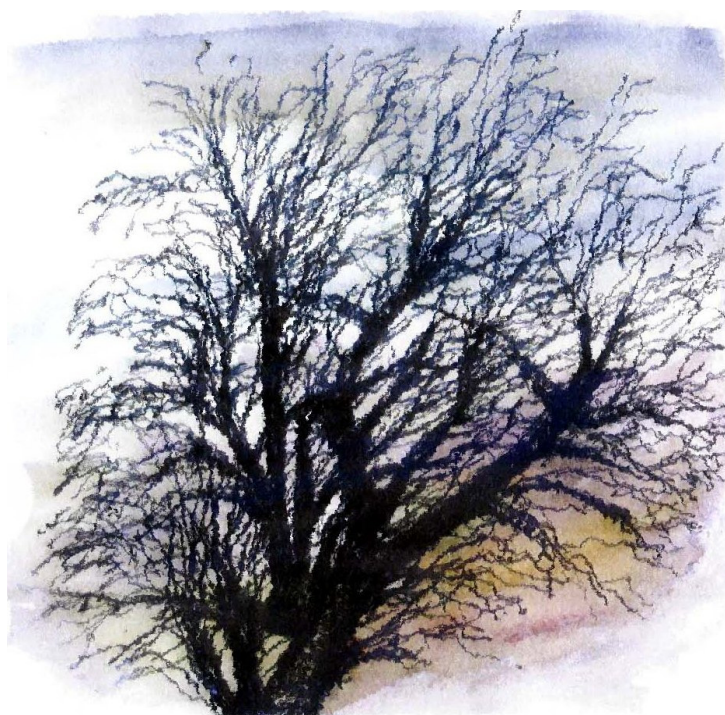
Vinterhimlen af Erik Bay