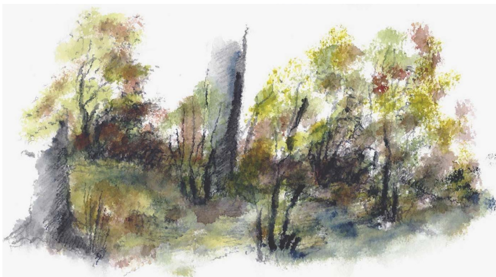
Illustrationer © 2010 Erik Bay