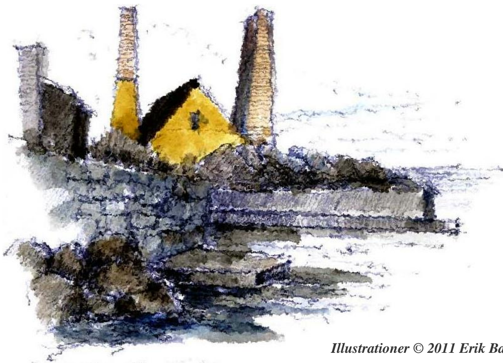
Illustrationer © 2011 Erik Bay