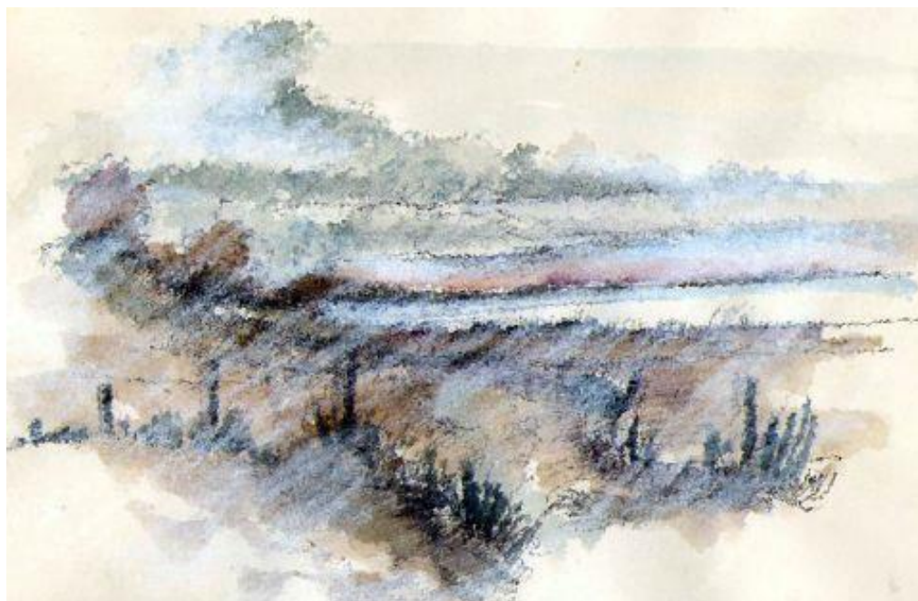
Illustrationer © 2015 Erik Bay