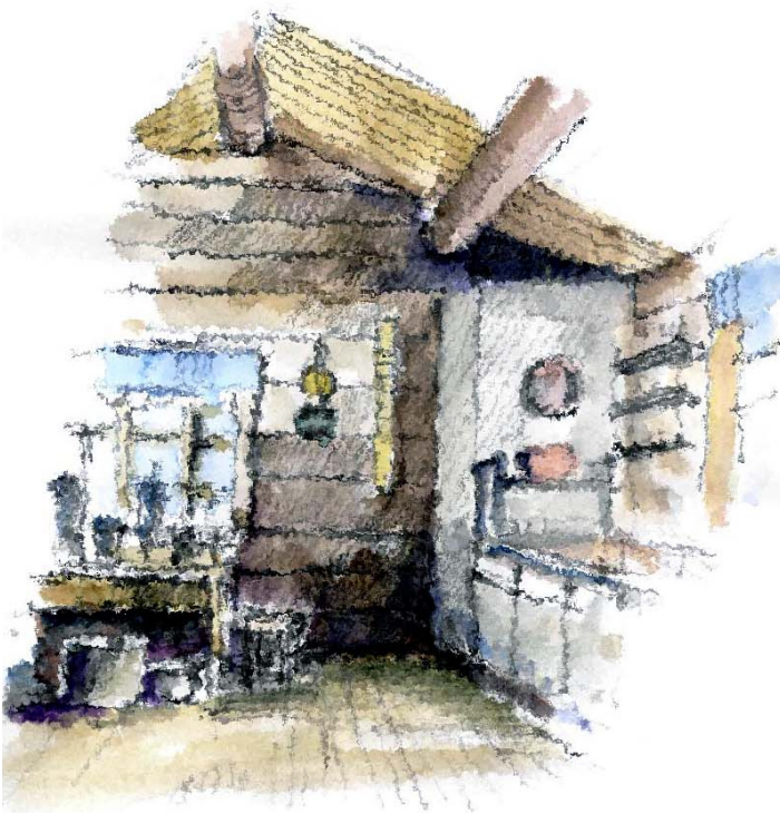
Hyttetur til Norge: Køkkenet Illustration: Erik Bay