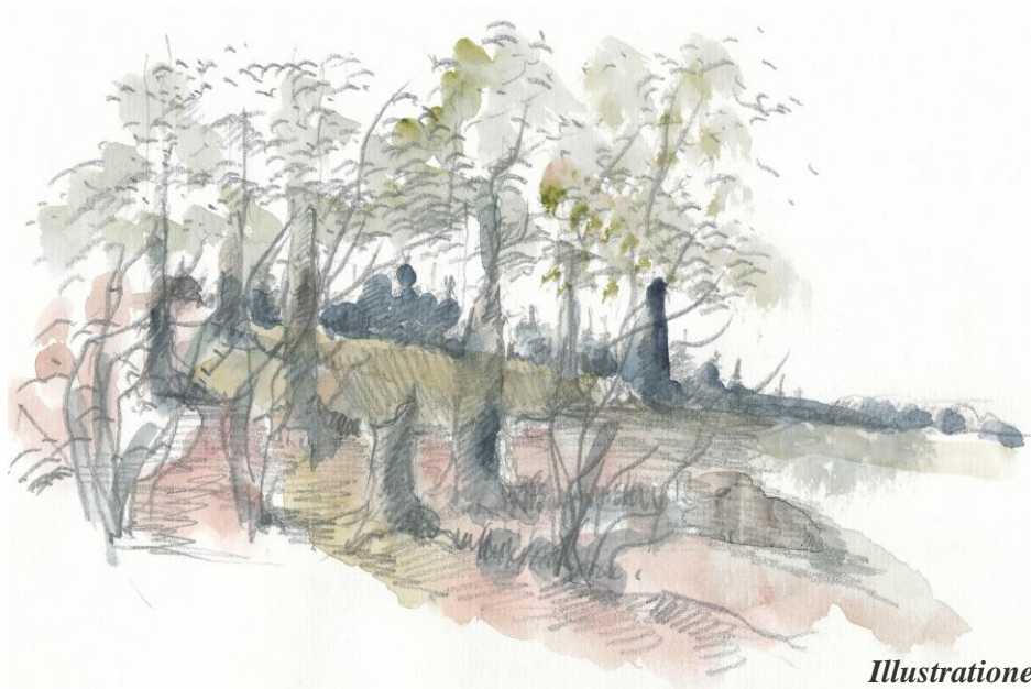
Illustrationer © 2014 Erik Bay