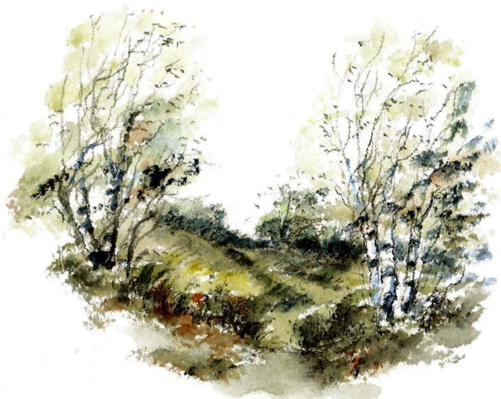
Dansk Vandrelaug, Lyngby Afdeling